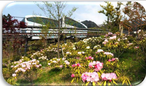
スロープカーでシャクナゲを眺めながら♪

阿知須 ~ 各地 ~ 小野田 → 小野田IC ~ 王司PA(休憩) ~ 小倉南IC → 6:30頃発 7:30頃 道の駅おおとう桜街道(休憩) → 英彦山神宮(参拝)・シャクナゲ → 9:00~9:20 9:40~11:30 のがみプレジデントホテル(昼食) → 千鳥屋本店 → 12:30~13:10 13:20~13:40 添田町めんべい工場(試食・買物・お土産付き) → 小倉南IC ~ めかりPA(休憩) ~ 14:30~15:20 小野田IC → 小野田 ~ 各地 ~ 阿知須 18:30頃