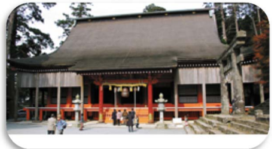
英彦山神宮奉幣殿