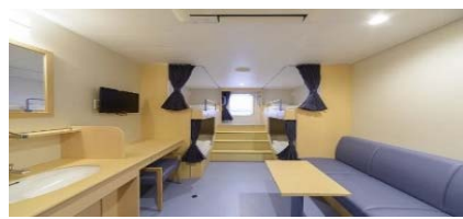
デラックス4人部屋