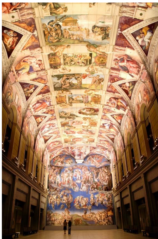
システィーナ・ホール