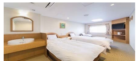
デラックス2人部屋

☆2等スタンダード洋室のご利用となります(相部屋)☆ 個室をご希望の方はお問い合わせください。