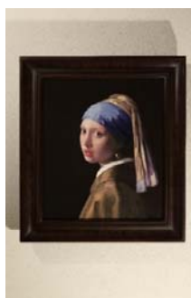
真珠の耳飾りの少女

西洋名画1,000余点 オリジナル原寸大の陶板で再現 大迫力の世界初陶板名画美術館 ◎到着後60分の作品案内あり