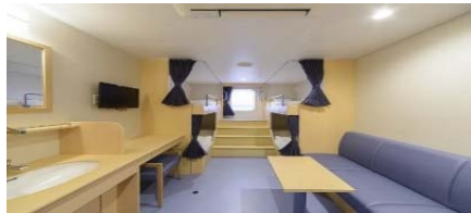
デラックス4人部屋