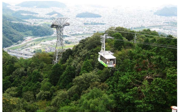
書写山ロープウェイ(往復利用)