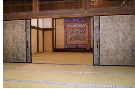
圧倒される舞台造りの摩尼殿