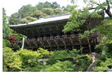
手つかずの自然に調和する伽藍 侘びた風情!