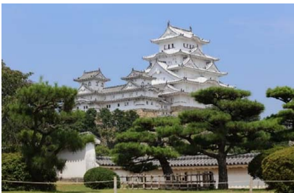
白い天守によみがえった姫路城(世界遺産・国宝)