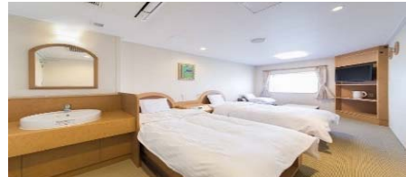
デラックス2人部屋