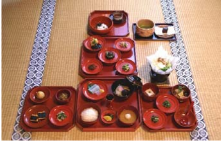
古来より代々伝えられてきた本物の精進料理