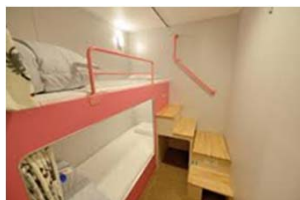
2等スタンダード洋室 スリッパ・タオル・歯ブラシなどは、ついていません。