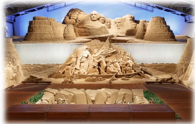
※イメージ 前回(第10期・アフリカ編)の画像