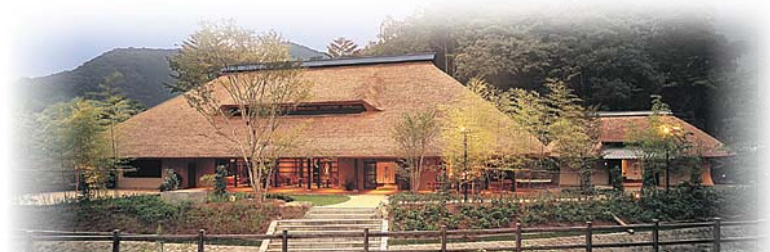
自然食レストラン 茅乃舎

阿知須駅前 → 各所 → 小野田駅前 → 小野田IC ~途中休憩~ 古賀IC → 7:00頃 自然食レストラン 久原本家 茅乃舎【昼食】 ~ 椒房庵【お買物】 → 10:45~12:45 ~13:50 古賀SA(休憩・買物) → TOTOミュージアム → 北九州都市高速 14:10~14:40 15:30~16:40 ~途中休憩~ 小野田IC → 小野田駅前 → 各所 → 阿知須駅前 19:00頃