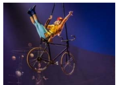
エアリアル・バイシクル