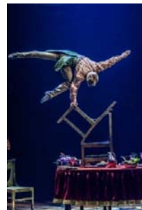
バランスィング・オン・チェア