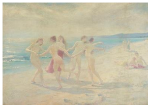
ルイ=ジョゼフ=ラファエル・コラン 《海辺にて》1892年