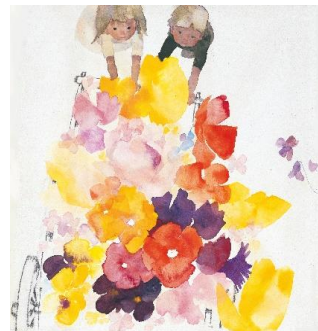
《はなぐるま》絵雑誌『こどものせかい』1968年4月号 至光社 1967年 ちひろ美術館蔵