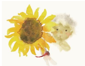
《ひまわりとあかちゃん》1971年 ちひろ美術館蔵